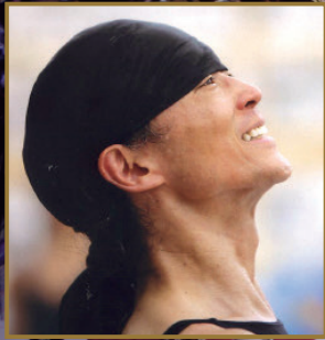
台本・構成・演出・振付 清水哲太郎 Tetsutaro Shimizu

ペスト禍の絶望の中世から希望のルネサンスにおどり出て来た人類は どんなことに襲われようとも動かしがたい人間性の気品をばねとして 当然のように人々の幸福のため“どん底”を“希望”に変える。